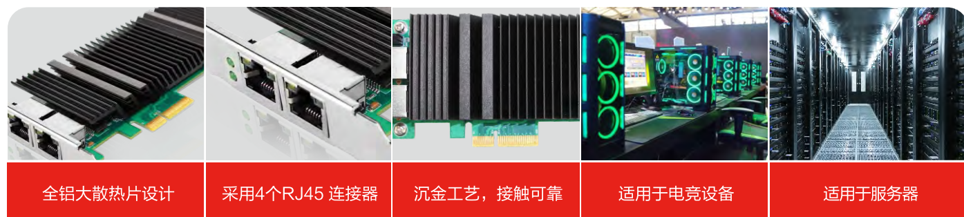
全铝大散热片设计

YF PCIe4-2LAN 自适应外部设备所需功耗输出: Cas 0,Class 1,兼容标准的各种工业相机和摄像头, 可同时允许两个端口以全双工的模式工作, 节能以太网和DMA合并以太网电源管理技术, 支持即插即用标准规范、支持远程启动。可满足服务器等行业领域对海量存储性能的个性化要求。