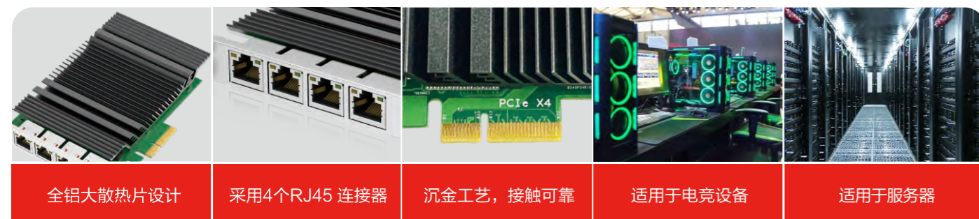
全铝大散热片设计

YF PCIEX4-4LAN 自适应外部设备所需功耗输出: Class 0, Class 1, Class 2, Class 3, 兼容标准的各种工业相机和摄像头, 可同时允许四个端口以全双工的模式工作, 节能以太网和DMA合并以太网电源管理技术, 支持即插即用标准规范、支持远程启动。可满足服务器等行业领域对海量存储性能的个性化要求。